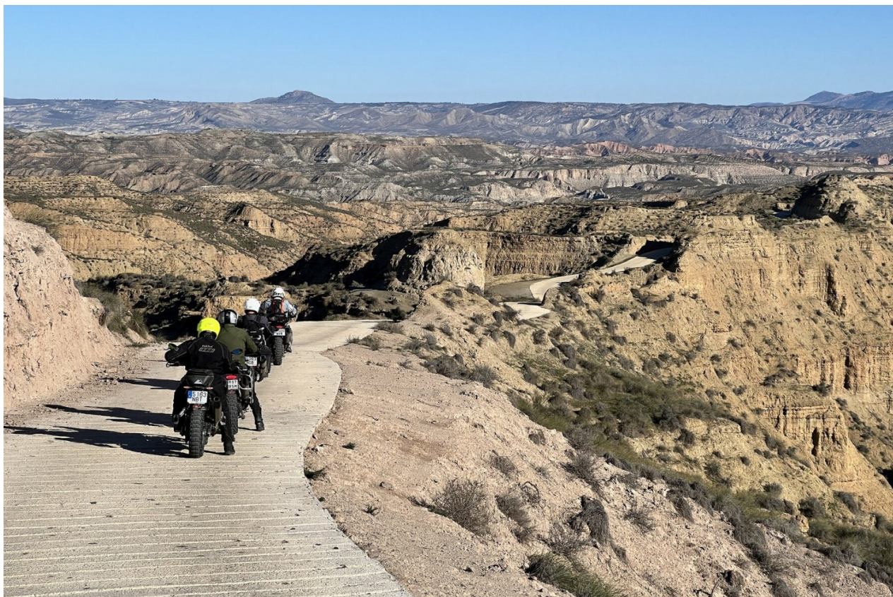
Gorafeöknen, ett unikt canyonlandskap

Förarutbildning med hojkörning i världsklass