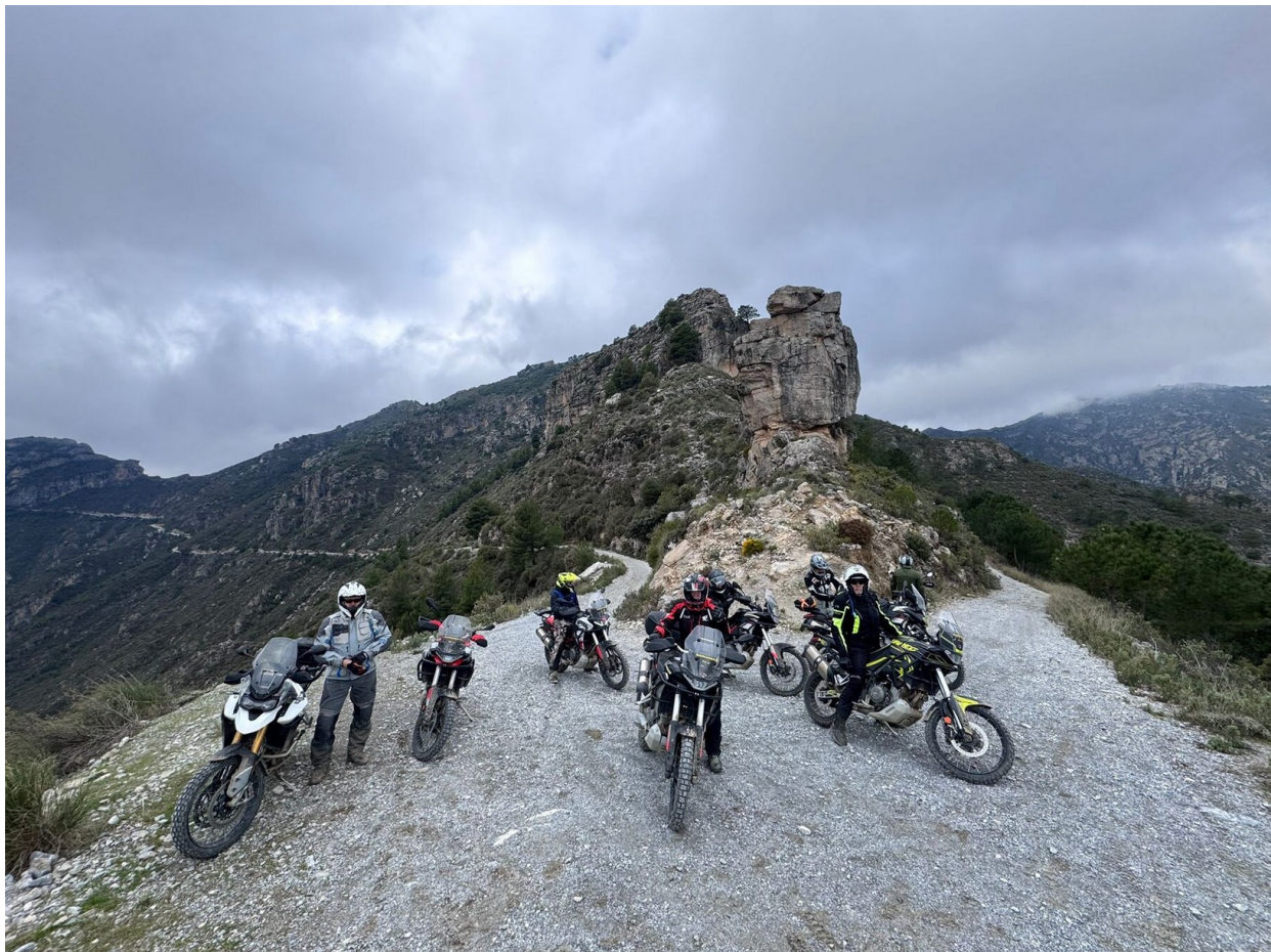
Vi rör oss bortom de turisttyngda vägarna, ofta på terräng man minns länge.